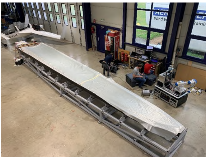
Abb. 1 Form einer Rotorblattspitze mit ausgelegten Faserlagenpaket bei Aeroconcept GmbH