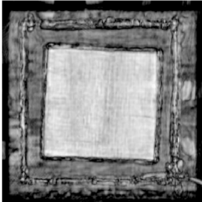
Abb. 2 Radarbilder eines Faserlagenpakets mit nicht erkennbarer Ondulation unter der Oberfläche. Hier ist die Kopolarisation zu sehen.