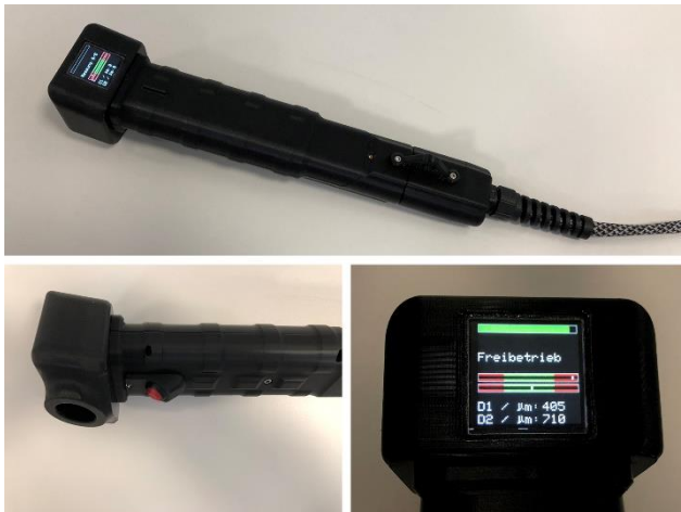
Abb. 3 Der Messkopf des mobilen Terahertz-Systems bietet ein Farbdisplay mit Signalstärke-Feedback, Betriebsmodus und Schichtdicken-Ergebnissen.