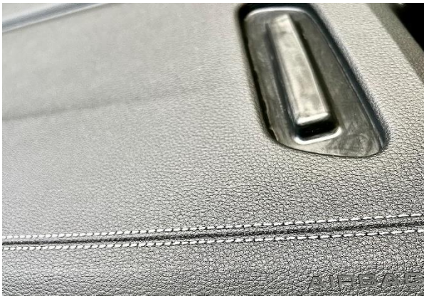
Abb. 1 Moderne Slush-Häute sind nicht nur aus optischen Gründen ungleichmäßig strukturiert und bestehen aus mehreren Schichten.