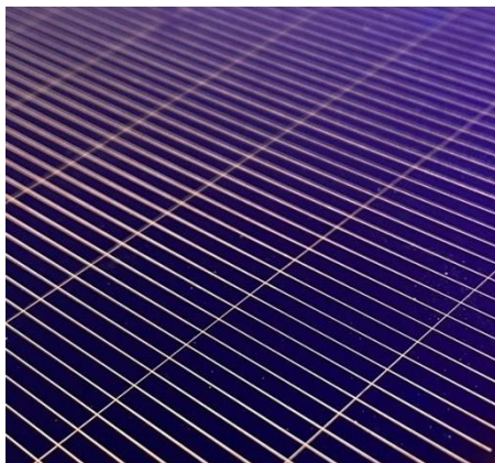
Abb. 1 Die Leiterbahnen aus Kupfer sind mit 19 Mikrometer extrem dünn. Deshalb ist auch die Verschattung der lichtempfindlichen Siliziumschicht sehr gering.