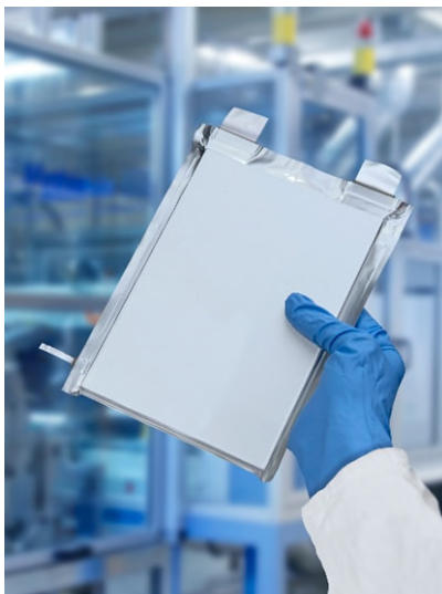
Akkumulatorzelle mit Referenzelektrode