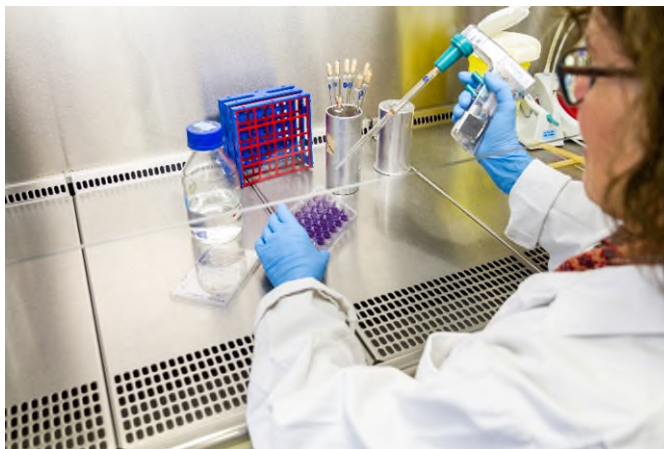
Abb. 1 Mit einem Plaque-Assay prüfen Forschende an Zellkulturen, ob Viren infektiös sind.