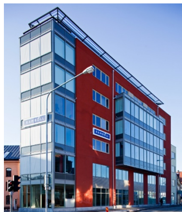
Abb. 4 Dieses Bürogebäude in Uppsala, Schweden wurde mit Switch2Save-Fenstern ausgestattet. Es dient als Demonstrator-Gebäude und hilft, die Technologie zu erproben und weiterzuentwickeln.