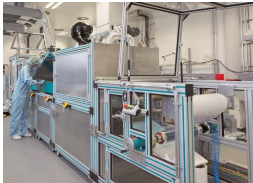
Abb. 3 Die Beschichtungen werden im Rolle-zu-Rolle-Verfahren hergestellt. Mit wenigen 100 µm sind sowohl die elektrochrome Folie als auch das thermochrome Dünnglas-Substrat extrem dünn.