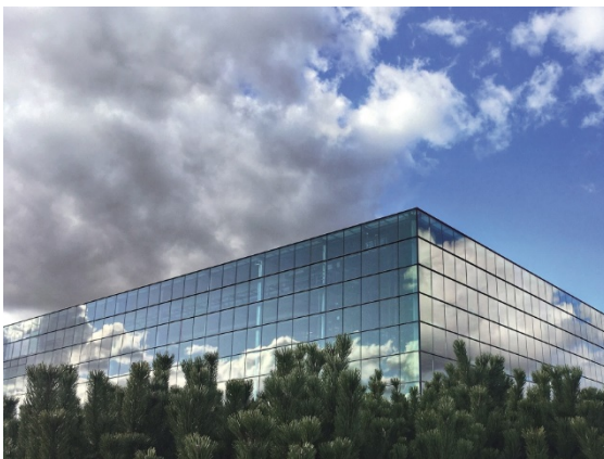
Abb. 1 Bei Gebäuden mit großen Glasfronten ermöglicht die Ausstattung mit elektro- oder thermochromen Fenstern Energieeinsparungen von bis zu 70 Prozent bei Heizung und Kühlung.

Die Klimaerwärmung und die Ziele des europäischen Green Deal werden die Nachfrage nach energieeffizienter Gebäudetechnik in den nächsten Jahren deutlich steigen lassen. Noch vor 2050 sollen alle Gebäude in der EU CO 2 -neutral sein. Dazu leisten die elektro- und thermochromen Fenster des EU-Projekts Switch2Save einen wichtigen Beitrag.