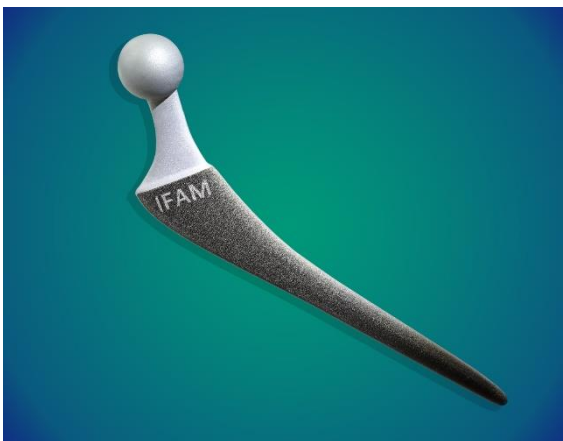
Abb. 1 Hüftschaftelement mit hybrider Beschichtung im Schaftbereich.