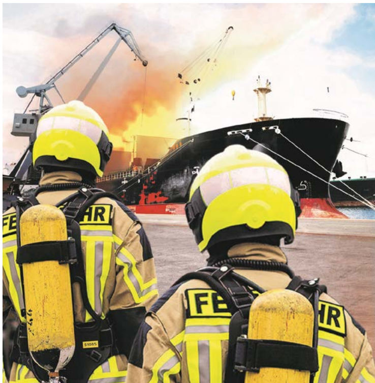
Abb. 2 Brände auf Schiffen: eine besondere Herausforderung für die Feuerwehr